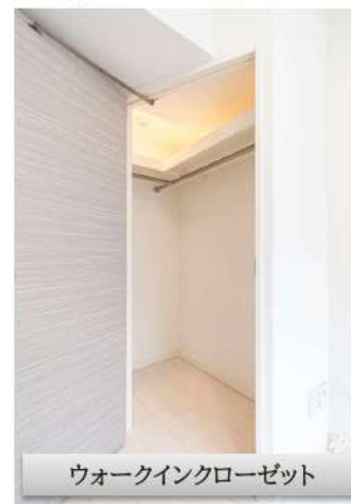
ウォークインクローゼット