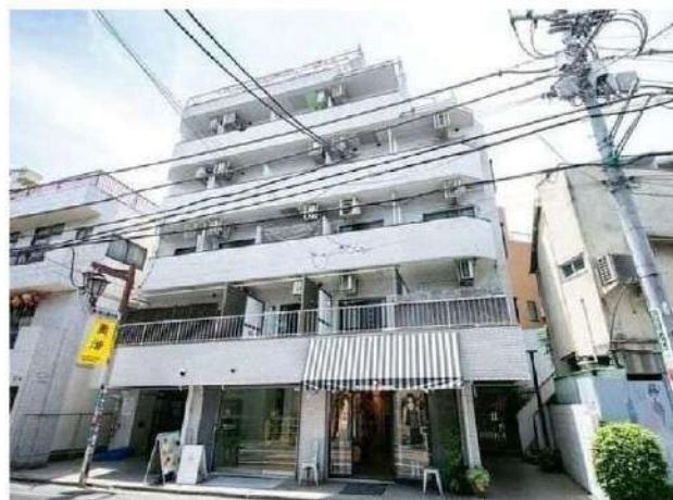
外観写真 イメージ