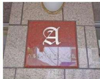
外観写真 イメージ