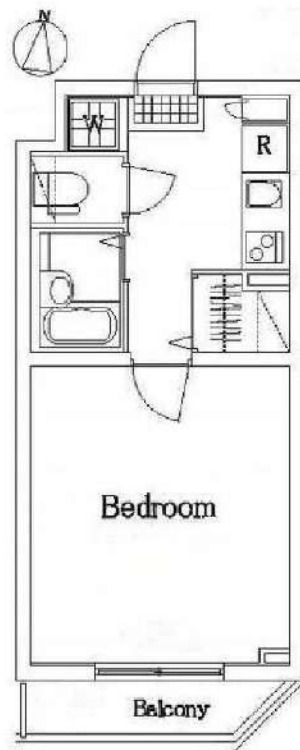
図面が現状と異なる場合は現状優先とします。 更新料:新賃料の1.5ヶ月分