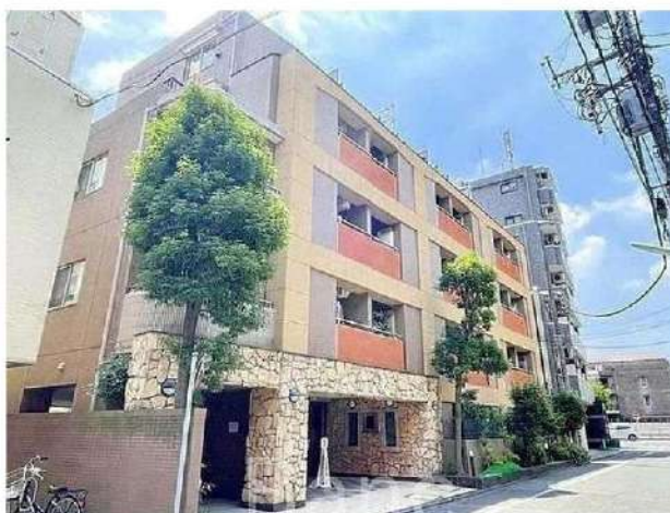
外観写真イメージ