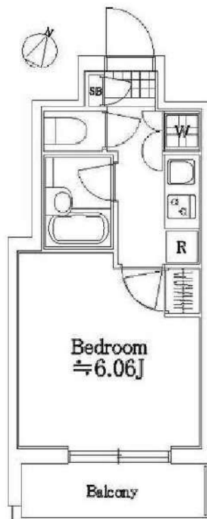
図面が現状と異なる場合は現状優先とします。 更新料:新賃料の1.5ヶ月分