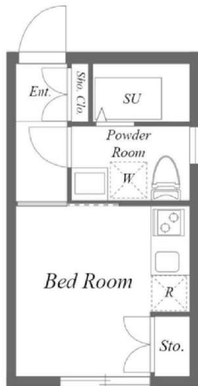
図面が現状と異なる場合は現状優先とします。 更新料:新賃料の1ヶ月分