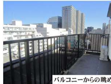
バルコニーからの眺め