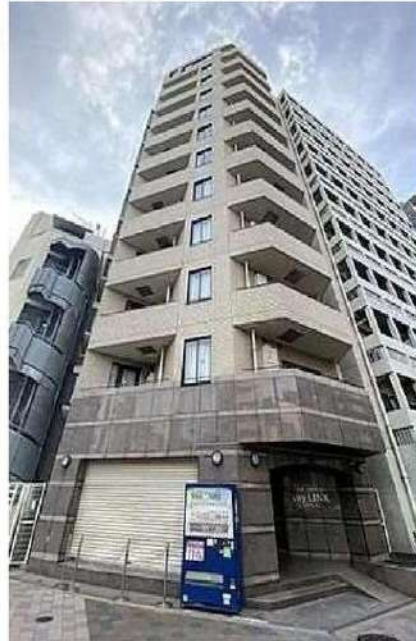
外観写真 イメージ