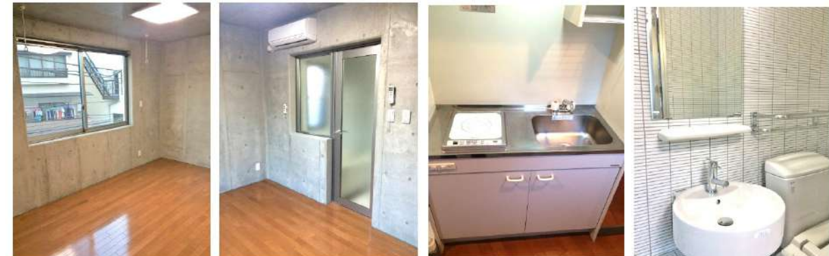
図面と相違する場合は現況を優先します