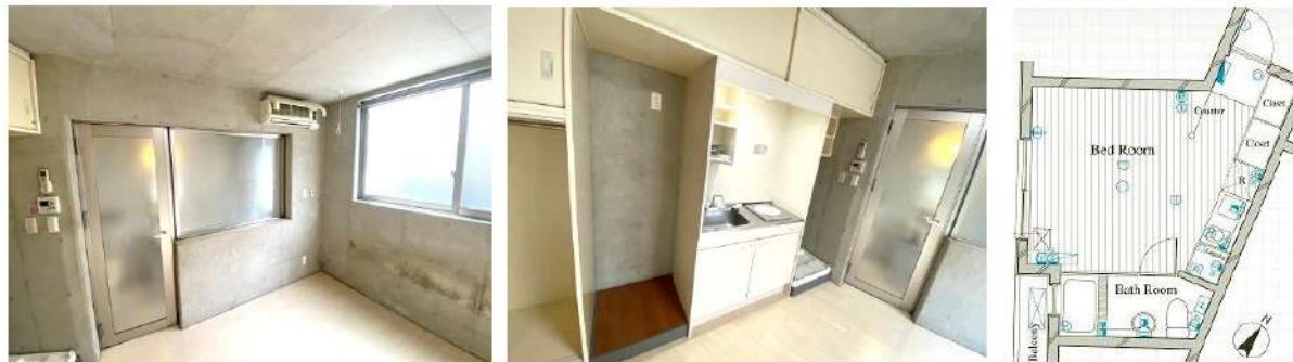
図面と相違する場合は現況を優先します