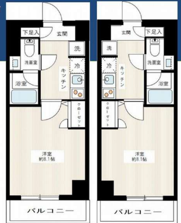
305号室 405号室 306号室