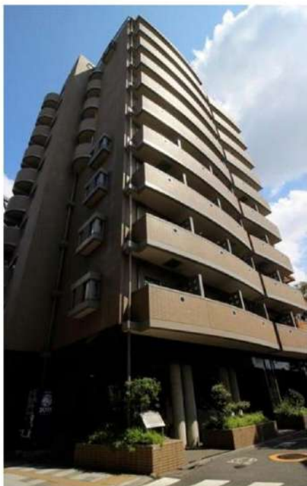
外観写真 イメージ