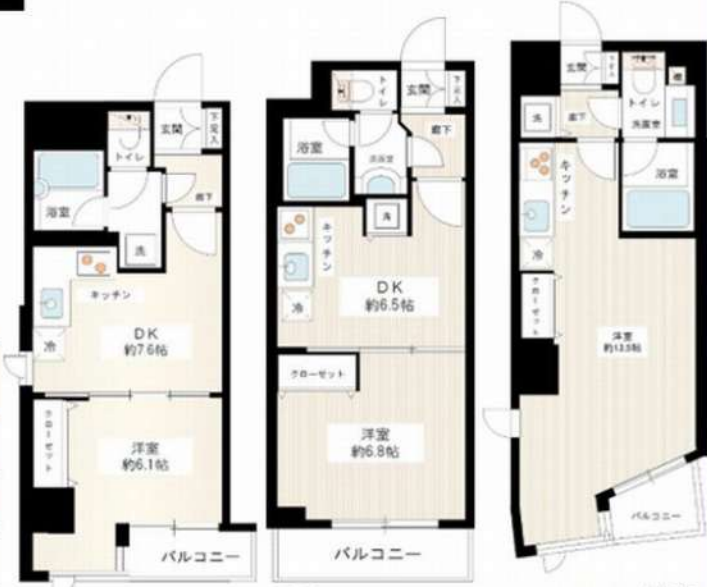
907号室 1005号室 1108号室