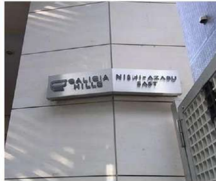
外観写真 イメージ