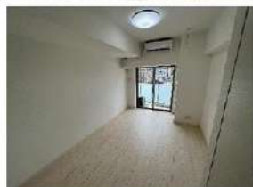
※別部屋の写真です