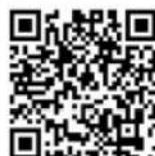
イメージ動画 (注)IoT 非対応