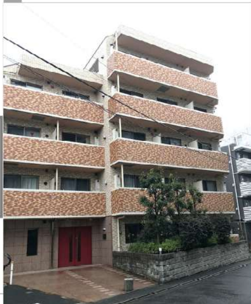
GENOVIA HILLS Nishimagome - Rosso