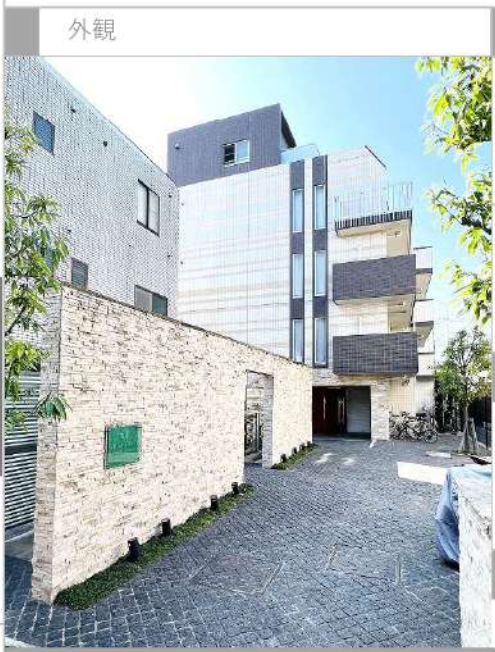
VOGA CORTE Kamata Minami

共用部 駐車場・バイク置場・駐輪場あり(要空き確認) 空き状況、使用方法、使用料については下記 共用部管理会社にお問い合わせください。 共用部管理会社 : (株)ライフポート西洋 03-6674-2694