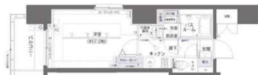
ZOOM両国/平面詳細図/D1・2・3・4タイプ