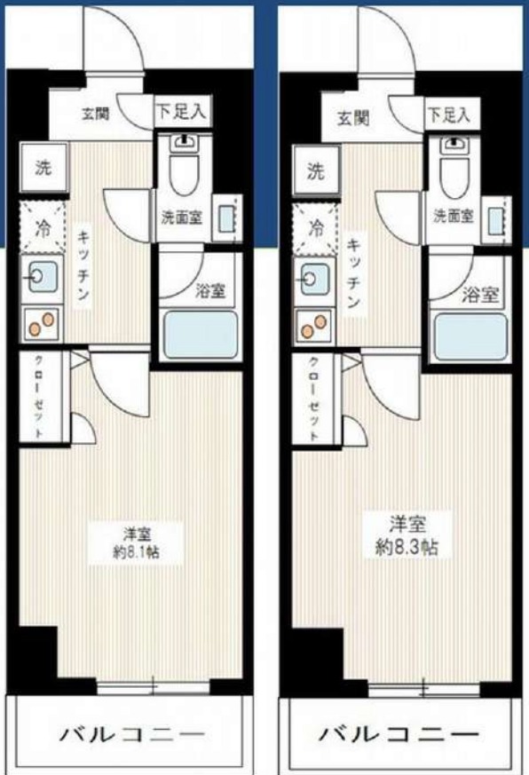
206号室 503号室 図面と現況が異なる場合は、現況優先と致します

～ご利用保証会社～ エボスROOM iD・ルームバンクインシア 初回保証料: 一律50% ※留学生プラン 初回: 毎月支払い合計額の100% (最低保証40,000円) 月額保証料 700円 外国人サポートプラン利用料 10,800円/年 (初年度より) ※初期費用のお支払いにクレジットカード決済をご利用可 ※法人様契約の際の諸条件は別途お問い合わせください